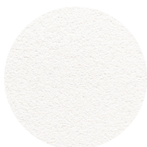
Hz Akustikpuds 03