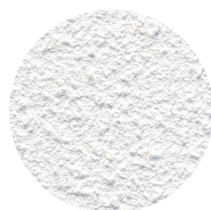
Hz Akustikpuds 09