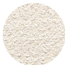
Hz Akustikpuds 07